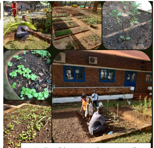
Le jardin pédagogique des maternelles