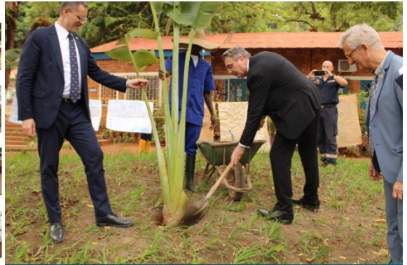
Inauguration du parcours botanique