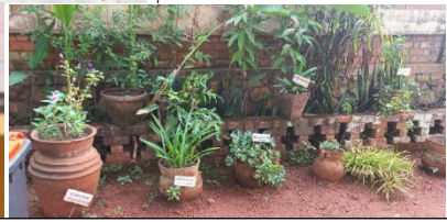
Recensement de la biodiversité