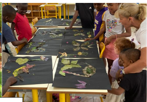
Les œuvres du CM1 A