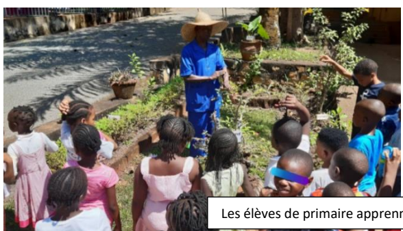
Les élèves de primaire apprennent à planter un arbre