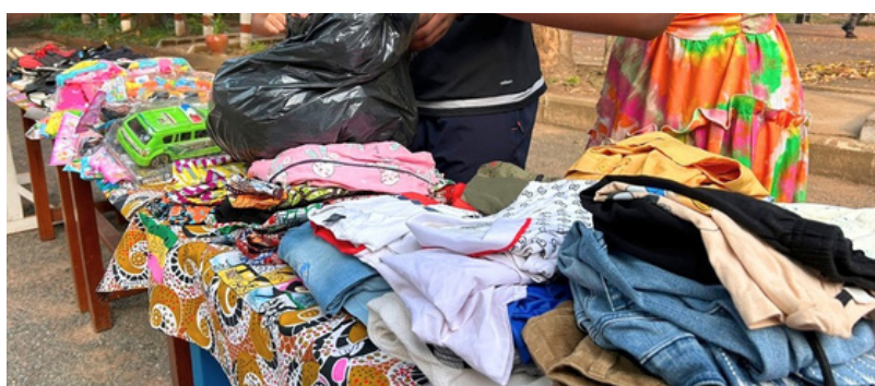
COLLECTE SOLIDAIRE (PAGE 2)