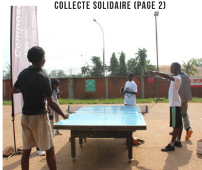
TOURNOI DE DÉTECTION EN TENNIS DE TABLE (PAGE 3)