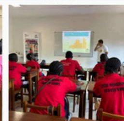
FORUM DES MÉTIERS ET DES FORMATIONS 2025: UN FRANC SUCCÈS (PAGE 2)