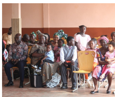
NOËL AVEC LES ENFANTS DU PERSONNEL : UNE PREMIÈRE AU LFCDG (PAGE 2)