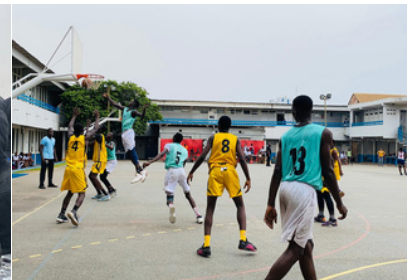
PALMARES DE LA SS DU LFCDG AU CSSBB LOMÉ

Rédacteurs : Jeunes reporters LFCDG Bangui