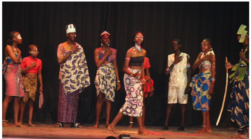
CONCOURS DE POÉSIES À L'AFB : GROUPE ÉLIT' MEILLEUR SCORE!