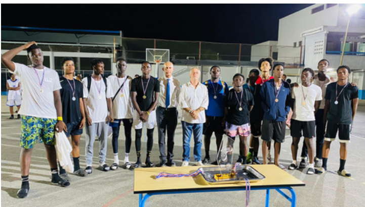
Remise des médailles aux équipes masculines