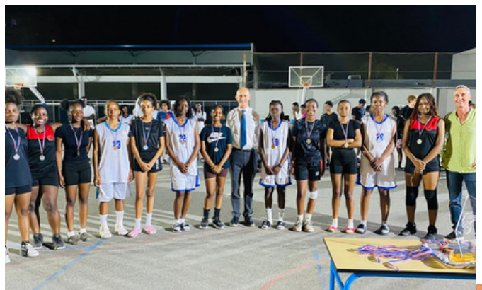
Remise des médailles aux équipes féminines