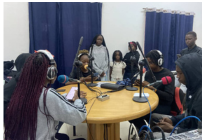
PARTICIPATION DES JEUNES REPORTERS AU GRAND DIRECT DE L'AEFE